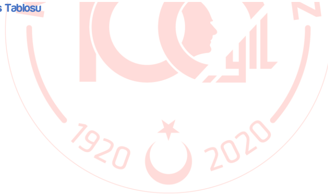
Tablo 37 - İdare Performans Tablosu